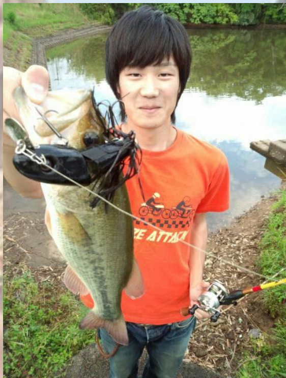
朝早くから船を出して釣ったお魚さんだそうです！ 投稿ありがとうございました！