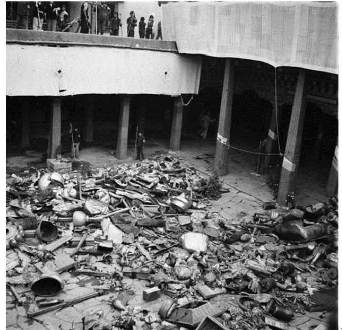
破壊されたチベット寺院と仏像