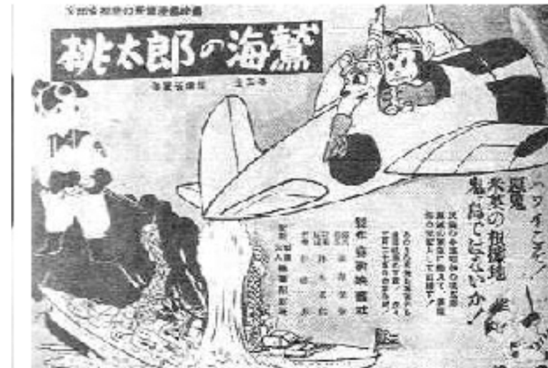
日本政府によるアニメ「桃太郎の海鷲（うみわし）」